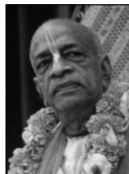
ŠRÍLA BHAKTIVÉDANTA SVÁMÍ MAHÁRÁDŽA (1896-1977)