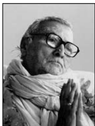
ŠRÍLA BHAKTI RAKŠAK ŠRÍDHARA MAHÁRÁDŽA (1895-1988)

Tento velký sanskritský učenec potkal Sarasvatího Thákuru v roce 1927 a o pouhé tři roky později vstoupil na jeho přání do životního stavu odříkání ( sannjása ). Později se stal známý jako jeden z nejčistších učenců a světců Šrí Čaitanjovy teistické školy bhakti-jógy .